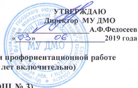
ГРАФИК участия в мероприятиях по трудовому воспитанию и профориентационной работе несовершеннолетних граждан (от 14 до 17 лет включительно) в ИЮНЕ 2019 года МУ ДМО (бригада ГБОУ СОШ № 3) с 03.06.19 по 28. 06.19 14 -15 ЛЕТ